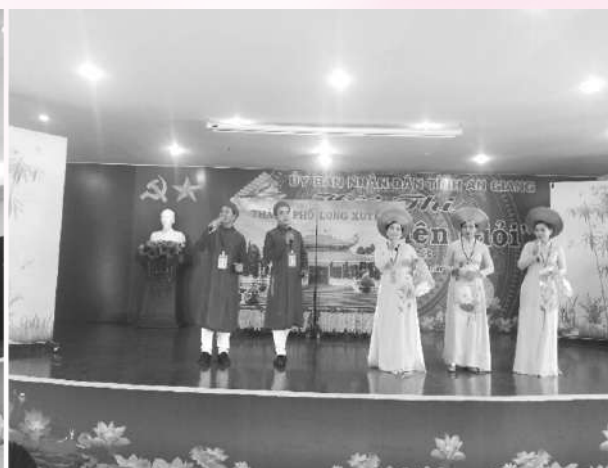
Các Đội dự thi thể hiện phần thi Tự giới thiệu

Kết thúc Hội thi Ban Tổ chức đã trao 01 giải nhất, 02 giải nhì, 03 giải ba và 05 giải khuyến khích. Đội tham dự Hội thi đến từ thành phố Long Xuyên đạt giải nhất; 02 giải nhì thuộc về đội đến từ huyện Châu Thành và thị xã Tân Châu; 03 giải ba thuộc về đội đến từ huyện Châu Phú, Thoại Sơn và thành phố Châu Đốc; đội thi đến từ huyện Tri Tôn, An Phú, Phú