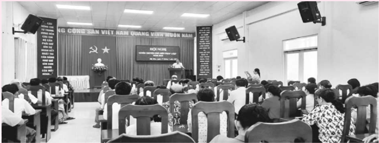
Hội nghị Tuyên truyền pháp luật về Dân chủ ở cơ sở tại huyện Châu Thành

Nam tỉnh đã xây dựng nhiều văn bản hướng dẫn và tổ chức nhiều Hội nghị triển khai Luật Phổ biến, giáo dục pháp luật trong cán bộ, công chức, người lao động, đoàn viên, hội viên. Hàng năm, Ban Thường trực Ủy ban MTTQ Việt Nam tiếp tục hướng dẫn hệ thống MTTQ và các tổ chức thành viên duy trì việc ban hành các văn bản triển khai, tổ chức thực hiện, kết quả đã ban hành hơn 1.600 văn bản, trong đó cấp tỉnh ban hành trên 300 văn bản, cấp huyện và cấp xã ban hành hơn 1.300 văn bản để phục vụ công tác tuyên truyền. Chủ động ký kết 05 chương trình với Ban Dân tộc tỉnh, với các Đoàn thể Chính trị - Xã hội, với Ban Trị sự Phật giáo Việt Nam, Ban Trị sự Phật giáo Hòa hảo và Tổng Đại diện Giáo phận Long Xuyên và 05 Đề án tuyên truyền với Sở Lao động - Thương binh và Xã hội, Sở Giáo dục và Đào tạo, Bộ Chỉ huy Bộ đội biên phòng tỉnh và Sở Tư pháp.