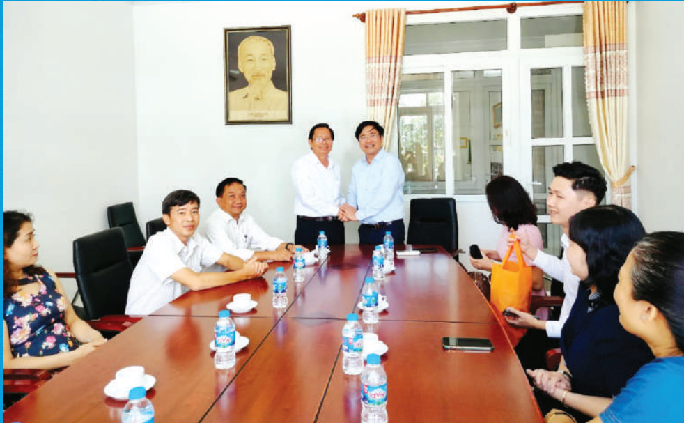
Lãnh đạo Viện Chiến lược và khoa học pháp lý - Bộ tư pháp thăm và làm việc tại Sở Tư pháp An Giang

78 NĂM THÀNH LẬP NGÀNH TƯ PHÁP (28/8/1945 - 28/8/2023)