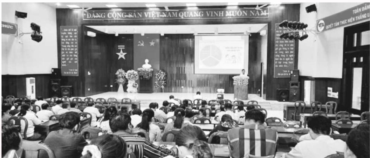
Hội nghị tập huấn PL cho MTTQ ấp, khóm tại Tịnh Biên do Sở Tư pháp phối hợp tổ chức

Sinh thời Chủ tịch Hồ Chí Minh luôn xác định tuyên truyền là công cụ quan trọng để tạo ra lực lượng mới hùng mạnh cho cách mạng, thấm nhuần tư tưởng chỉ đạo đó của Bác Hồ, đội ngũ cán bộ, công chức MTTQ Việt Nam các cấp càng quyết tâm, cố gắng hơn nữa để làm tốt công tác tuyên truyền, phổ biến, giáo dục pháp luật, phát huy quyền làm chủ của Nhân dân, tạo niềm tin vững chắc giữa Nhân dân với Đảng và Chính quyền, góp phần xây dựng Nhà pháp quyền Việt Nam XHCN của Nhân dân, do Nhân dân, vì Nhân dân.