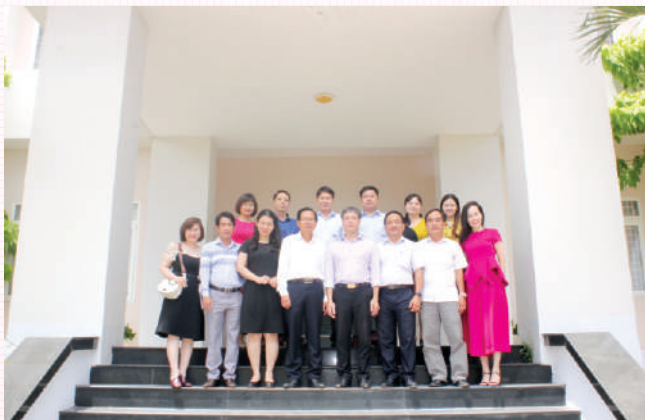
Ban Lãnh đạo Sở Tư pháp tỉnh An Giang tiếp Đoàn công tác Bộ Tư pháp.