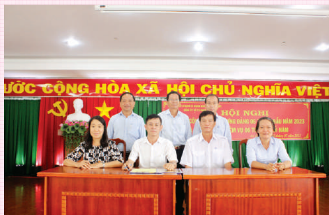
Ban lãnh đạo Sở Tư pháp cùng lãnh đạo các phòng, đơn vị thuộc Sở trong buổi lễ ký kết giao ước thi đua năm 2023.