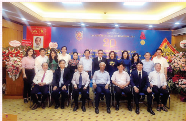
Lãnh đạo Sở Tư Pháp An Giang chụp hình tại buổi kỷ niệm 20 năm Ngày thành lập Cục kiểm tra văn bản quy phạm pháp luật (người đứng vị trí thứ 6, hàng trên, từ trái qua phải).