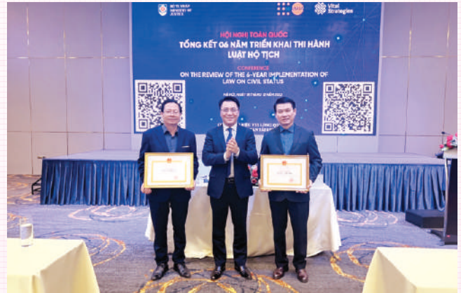
Lãnh đạo Sở Tư pháp An Giang dự Hội nghị toàn quốc về triển khai Luật Hộ tịch do Bộ Tư pháp tổ chức.