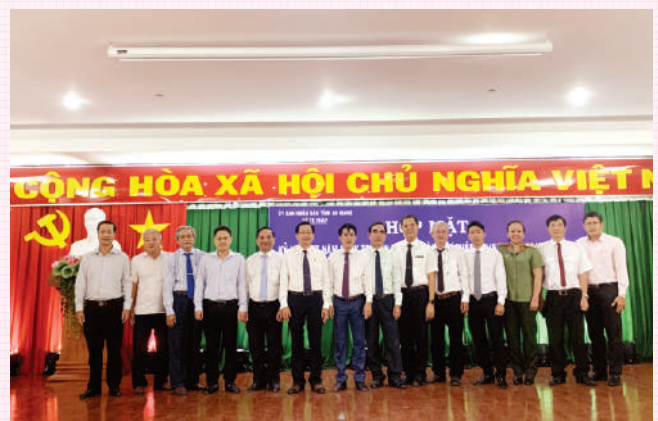
Ban lãnh đạo Sở Tư pháp chụp hình lưu niệm cùng khách mời tham dự buổi lễ kỷ niệm ngày thành lập Ngành Tư pháp.