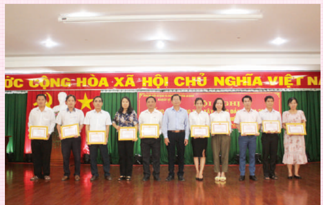
Lãnh đạo Sở trao tặng giấy khen cho tập thể, cá nhân đạt thành tích xuất sắc trong thực hiện nhiệm vụ.