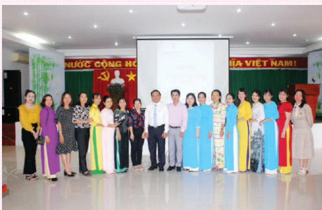
Lãnh đạo Sở Tư pháp chụp ảnh lưu niệm cùng tập thể phụ nữ Sở nhân ngày 20-10.