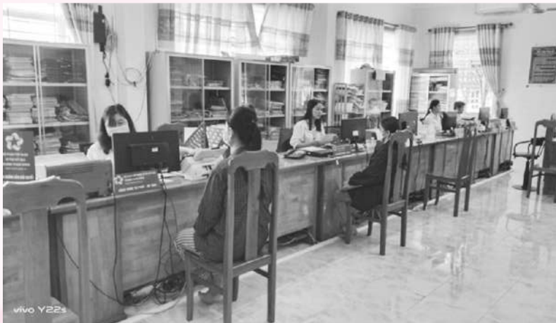
Kiểm tra 6 tháng đầu năm tại các xã, thị trấn

Trên cơ sở kế hoạch số 264/KH-PTP ngày 14 tháng 7 năm 2023 của Phòng Tư pháp huyện Phú Tân về việc kiểm tra thực hiện công tác Tư pháp cấp xã 6 tháng đầu năm 2023, từ ngày 17/7 đến 24/7/2023, Phòng Tư pháp huyện Phú Tân đã thành lập đoàn kiểm tra và tiến hành kiểm tra công tác Tư pháp – Hộ tịch đối với các xã, thị trấn trên địa bàn huyện.