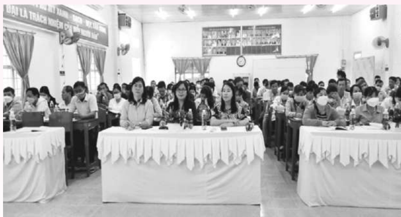
Quang cảnh hội nghị tuyên truyền pháp luật cho cán bộ Mặt trận cơ sở tại Phú Tân

Luật Phổ biến, giáo dục pháp luật được Quốc hội nước Cộng hòa xã hội chủ nghĩa Việt Nam khóa XIII, kỳ họp thứ 03 thông qua ngày 20 tháng 6 năm 2012 quy định rõ nhiệm vụ của Ủy ban Mặt trận Tổ quốc (MTTQ) Việt Nam và các tổ chức thành viên các cấp trong công tác tuyên truyền, phổ biến, giáo dục pháp luật đó là: Tổ chức phổ biến, giáo dục pháp luật cho hội viên, đoàn viên của tổ chức mình; vận động Nhân dân chấp hành pháp luật; phối hợp với cơ quan nhà nước, tổ chức hữu quan phổ biến, giáo dục pháp luật cho Nhân dân; tham gia và hỗ trợ hoạt động phổ biến giáo dục pháp luật và tham gia giám sát việc thực hiện chính sách, pháp luật về phổ biến, giáo dục pháp luật.