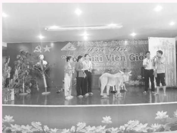
Đội dự thi thể hiện phần thi kỹ năng hòa giải

Tân, Chợ Mới và thị xã Tịnh Biên đạt giải khuyến khích. Bên cạnh đó, Ban Tổ chức cũng đã trao 04 giải phụ gồm các giải như đội có phần thi tự giới thiệu ấn tượng nhất, thí sinh ứng xử hay nhất, thí sinh hòa giải ấn tượng nhất và thí sinh cao tuổi nhất.