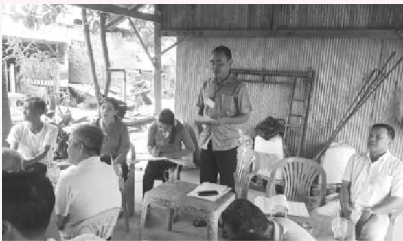
Quang cảnh buổi triển khai Cài đặt Nhóm Zalo tuyên truyền pháp Luật

đời sống hiện tại, cách phòng tránh dịch bệnh trên các loại cây trồng, phản ánh, kiến nghị của Nhân dân, công khai những chủ trương của địa phương cho cộng đồng dân cư nắm.