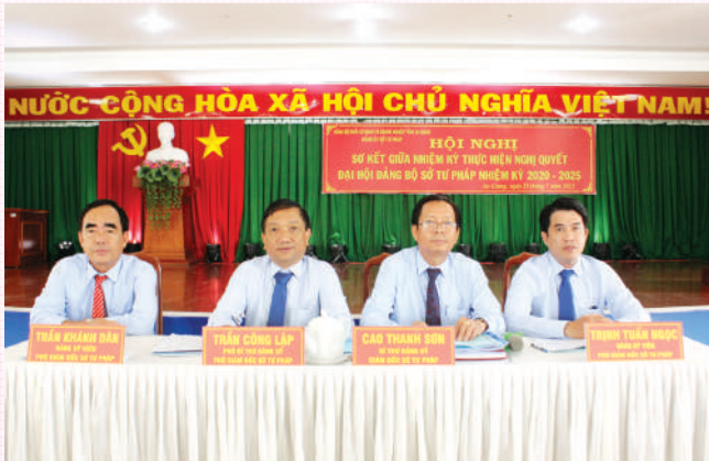
Ban lãnh đạo Sở Tư pháp tỉnh An Giang.